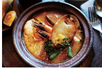
魚介たっぷりブイヤベース