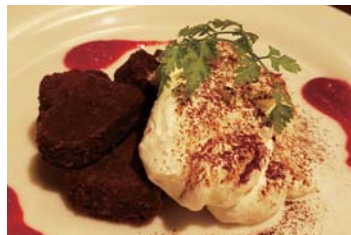
自家製ブラウニーとマスカルポーネクリームのパルフェ