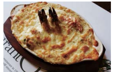
シーフードドリア