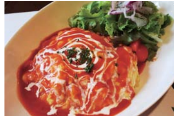
オムライスプレート