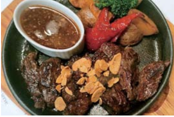
牛サガリカットステーキ150g