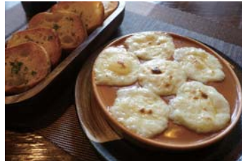
かにみそグラタン&ガーリックトーストセット