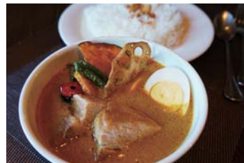
イエローカレー (豚角煮)