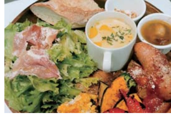
マンチキンプレート