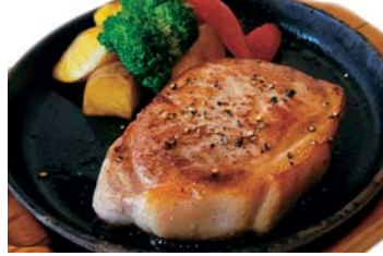
厚切ポークのコンフィステーキ