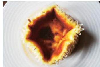
自家製バスクチーズケーキ