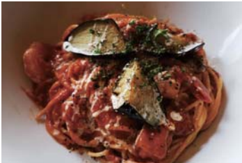
海老のトマトクリームパスタ