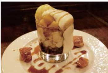
オズ風和風パルフェ