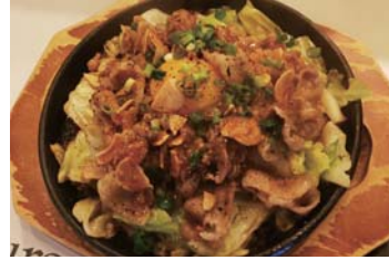
豚バラキャベツのスタミナ鉄板焼