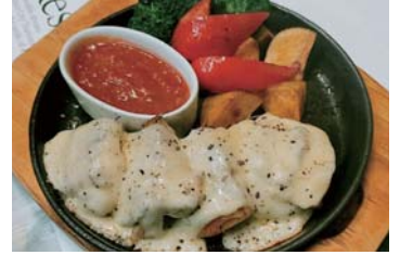
モッツアレラとハーブチキンの鉄板焼